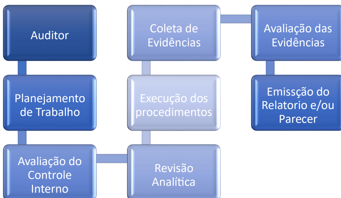
Figura 1: Processo de Auditoria

O planejamento da auditoria desempenha um papel essencial dentro da organização, pois é uma ferramenta de qualidade que apoia os gestores em suas tomadas de decisões, tornando-as mais eficazes. Na figura 1 se apresenta um fluxograma dos processos de uma auditoria.